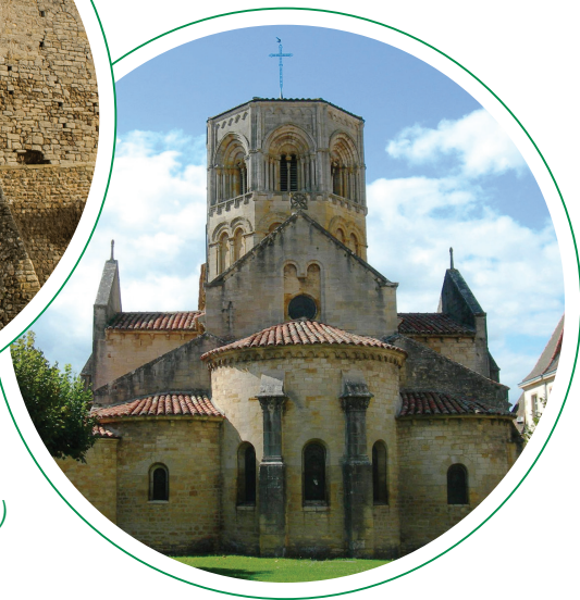
Église romane (12 ème siècle)