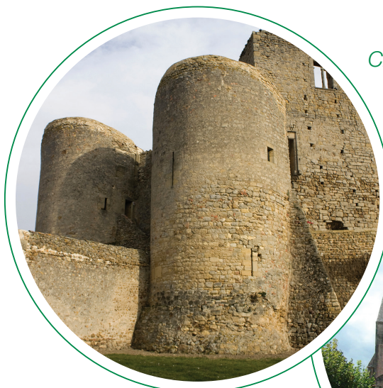
Château St Hugues (10 ème siècle)

Pour ce troisième rassemblement, nous serons heureux de vous accueillir à Semur en Brionnais , salle de la Mairie.